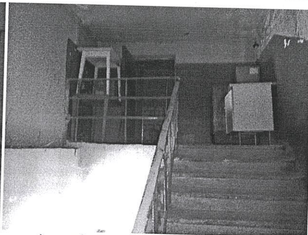
частина приміщення (вигородка) технічного поверху