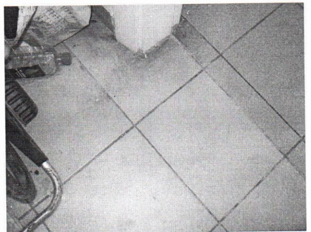
Види 6-10. Загальний вигляд та стан окремих конструктивних елементів об'єкту оцінки.